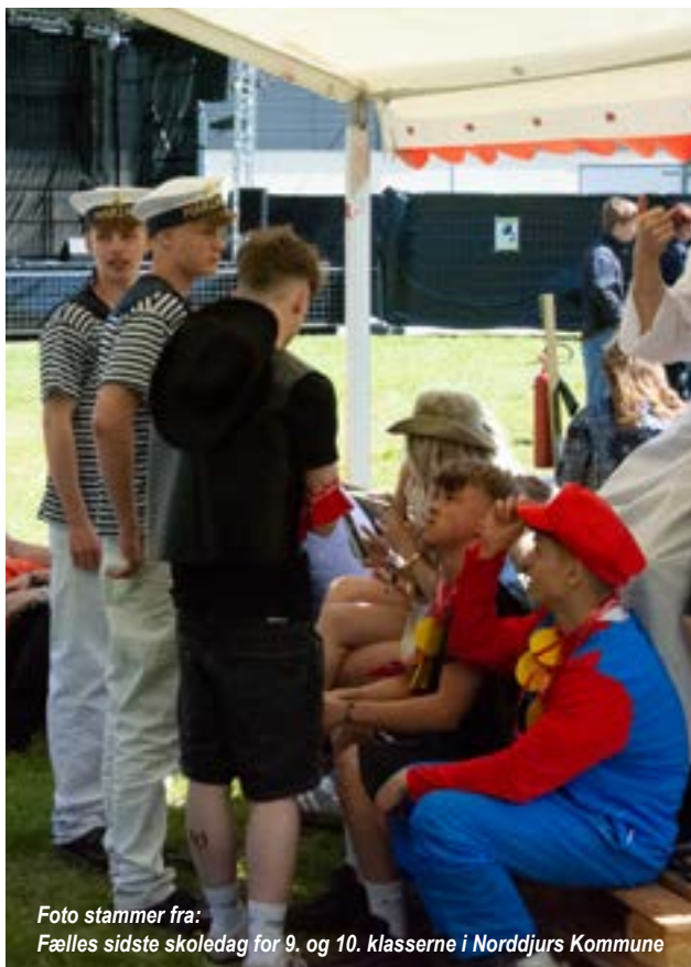
Foto stammer fra: Fælles sidste skoledag for 9. og 10. klasserne i Norddjurs Kommune

flere niveauer, fra generel trivsel til kriminalitetsforebyggelse. En vigtig del af arbejdet er at analysere lokale tendenser og rådgive skoler og institutioner om bekymrende adfærd. SSP-koordinatoren deltager i tværfaglige netværk, udarbejder handleplaner og politikker, og koordinerer indsatser mod særlige risikoområder som misbrug og radikalisering. Derudover formidles viden til borgere og fagfolk gennem oplæg, kampagner og undervisning. Endelig monitoreres og evalueres indsatsen løbende for at sikre, at forebyggelsesarbejdet er effektivt og relevant.