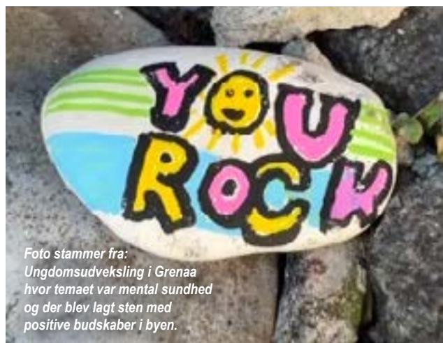
Foto stammer fra: Ungdomsudveksling i Grenaa hvor temaet var mental sundhed og der blev lagt sten med positive budskaber i byen.

Arresten er et 16+ miljø, hvor det er de unge, der sidder for bordenden og træffer beslutningerne. Arresten er et miljø med ungt ejerskab, hvor de unge er eksperterne, og deres drømme bliver til virkelighed igennem forskellige aktiviteter og arrangementer.