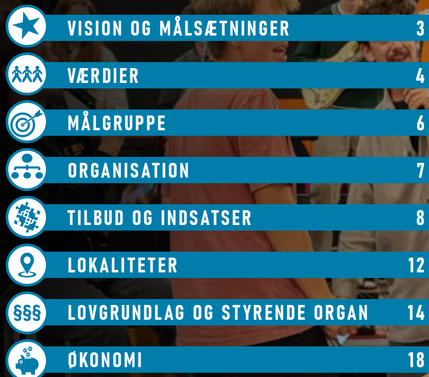
Foto stammer fra: Musikstarter Camp Djurs- land i efterårsferien 2025