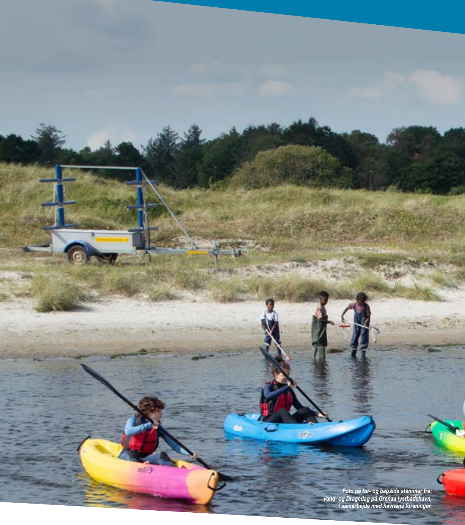
Foto på for- og bagside stammer fra: Vand- og Dragedag på Grenaa lystbådehavn, i samarbejde med havnens foreninger.

Mandag til onsdag: ..... kl. 8:00 - 16:00