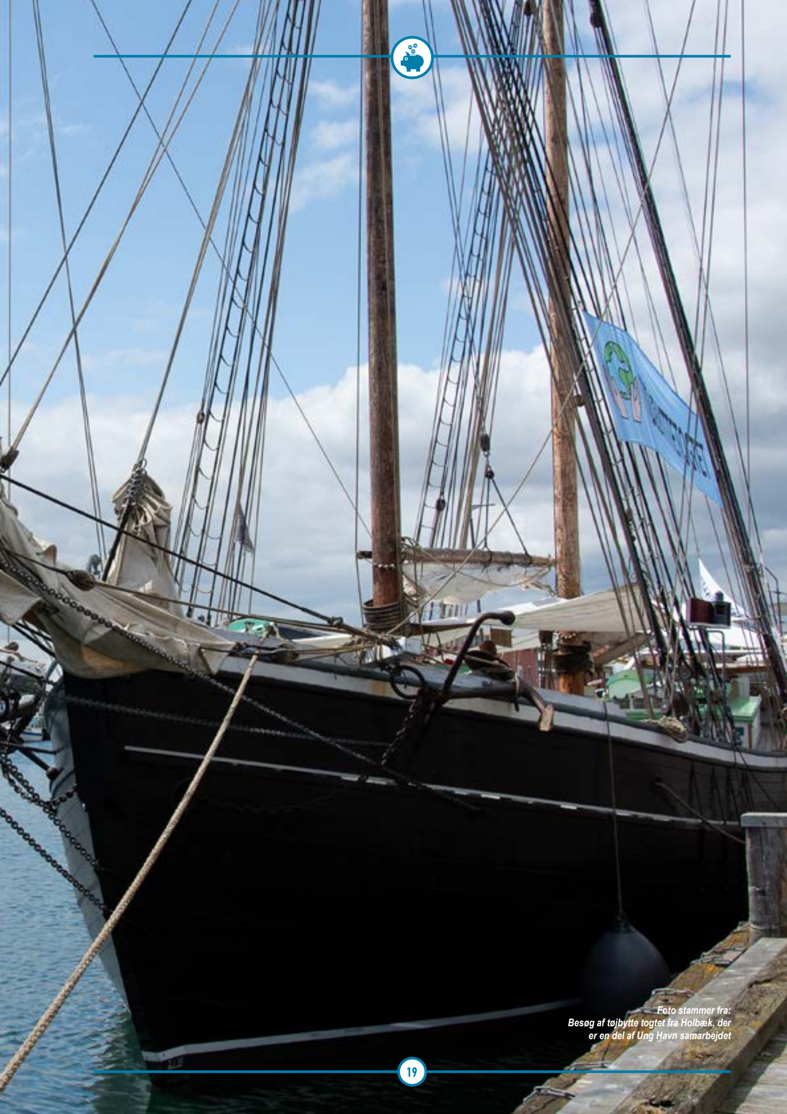
Foto stammer fra: Besøg af tøjbytte togtet fra Holbæk, der er en del af Ung Havn samarbejdet